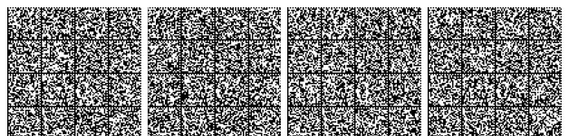
Tabella V.5- 3: Livello di prestazione per controllo dell'incendio